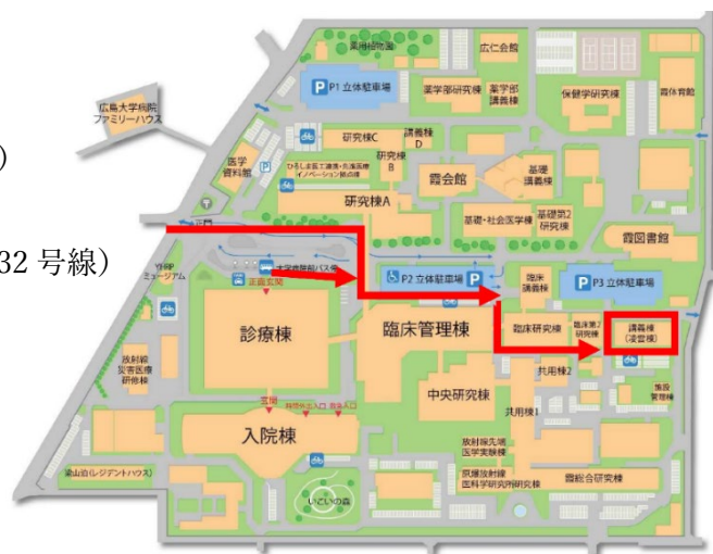
霞キャンパス配置図